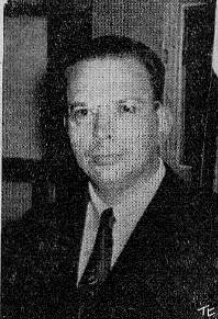
Reynaldo Galindo Phol

Conceptos de las interesantes declaraciones que para esta sección nos concede el señor Ministro de Cultura de El Salvador Doctor don Reynaldo Galindo Phol