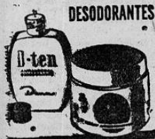
REGULA LA TRANSPIRACION DE LAS AXILAS Y LAS DESODORANTE POR VARIOS DIAS

Suscríbese a "MUNDO FEMENINO" Tel. 1024 — Apdo. 4343